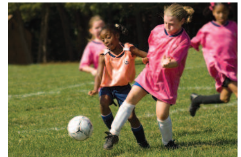
Numerosas poblaciones utilizan agua regenerada para riego de parques y zonas de recreo.

Toda el agua de la Tierra es agua reciclada, que se reutiliza a través de los ciclos naturales. No obstante, lo más usual es que, cuando escuchamos la expresión “agua regenerada” queramos decir agua residual que ha sido enviada desde nuestras viviendas o comercios a través de una tubería hasta una estación depuradora, donde ha sido tratada hasta un nivel de calidad apropiado al uso previsto o al método de vertido. A partir de ahí, el agua regenerada es enviada directamente por un sistema de distribución específico para su utilización en riego o refrigeración industrial.