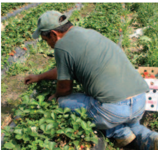
Un trabajador agrícola en un campo regado con agua regenerada.

Entre los riesgos percibidos figuran las consecuencias derivadas de la presencia de concentraciones traza de Productos Farmacéuticos y de Cuidado Personal (PFCPs) en el agua regenerada. No obstante, los resultados de un reciente estudio indican que, dependiendo del compuesto químico concreto y de las condiciones de exposición al mismo, podría ser necesaria una exposición al agua regenerada no-potable durante un periodo de entre unos pocos años hasta muchos millones de años, antes de que se pudiera alcanzar una exposición a los PFCPs equivalente a la registrada durante un solo día a través de nuestras actividades cotidianas.